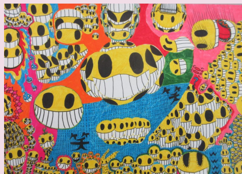
きらぼし★アート展 入選 「笑顔のたいぐん」