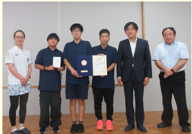
ラジオ体操優良団体等表彰を受彰