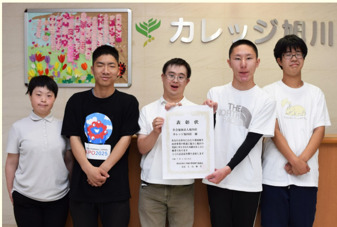
地域ゴミ拾いの取り組みから表彰

どちらもカレッジ生の体力向上を目指した取り組みの中で、地域の方に認めていただいて表彰を受けることができました。引き続き、地域の方々へ感謝の思いを忘れずに活動していこうと思います。