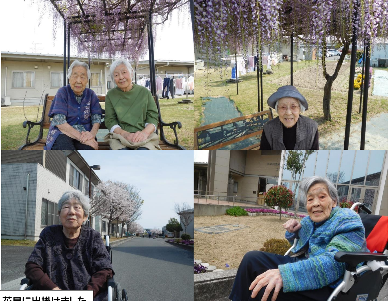
花見に出掛けました

令和4年5月 社会福祉法人旭川荘 結びの杜ホーム (定員 30名) 見学・お問い合わせ: ☎086-942-2030